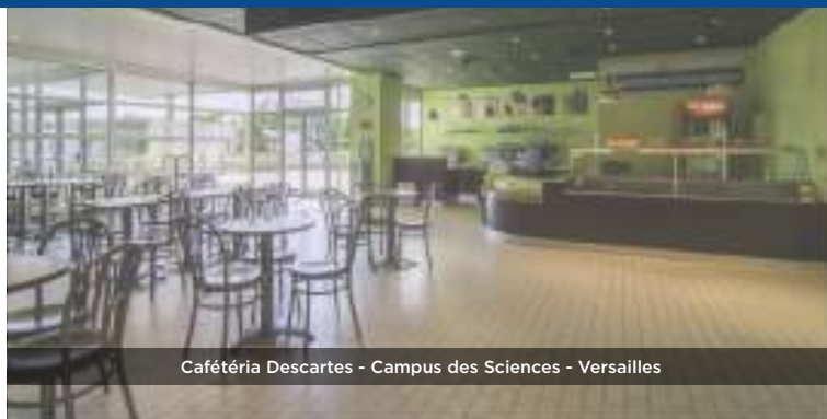
Cafétéria Descartes - Campus des Sciences - Versailles